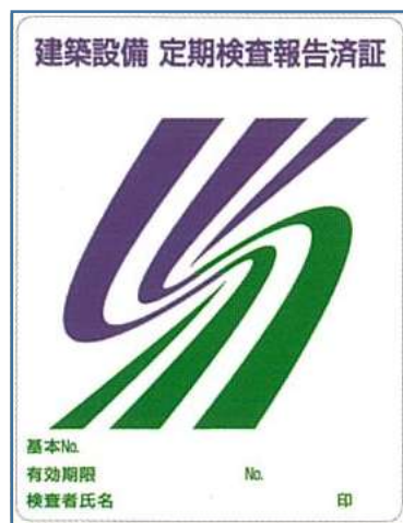
建築設備定期検査