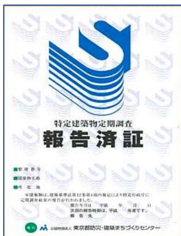
特定建築物定期調査